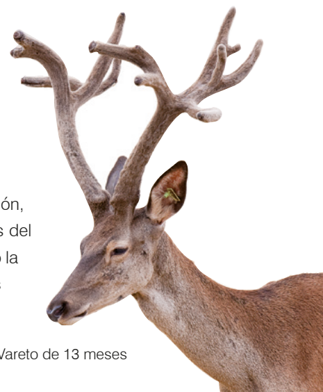
Vareto de 13 meses

Apuesta por el ciervo ibérico, acertada selección genética, firme compromiso con la investigación, rigor en las medidas sanitarias y todo ello respetando al máximo las características etológicas del ciervo. Este es el trabajo que, desarrollado de manera constante durante 25 años , ha motivado la consecución de dos récords nacionales absolutos de Ciervo Ibérico con animales procedentes de nuestra finca, convirtiendo a Lagunes Selección Genética en la genética de los récords de España .