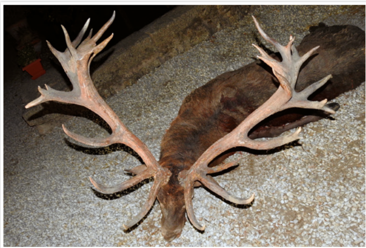
Mejor trofeo histórico de ciervo ibérico: 249,27 puntos C.I.C.