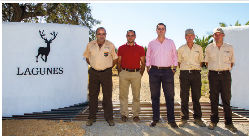
Equipo gestor con la guardería de Lagunes